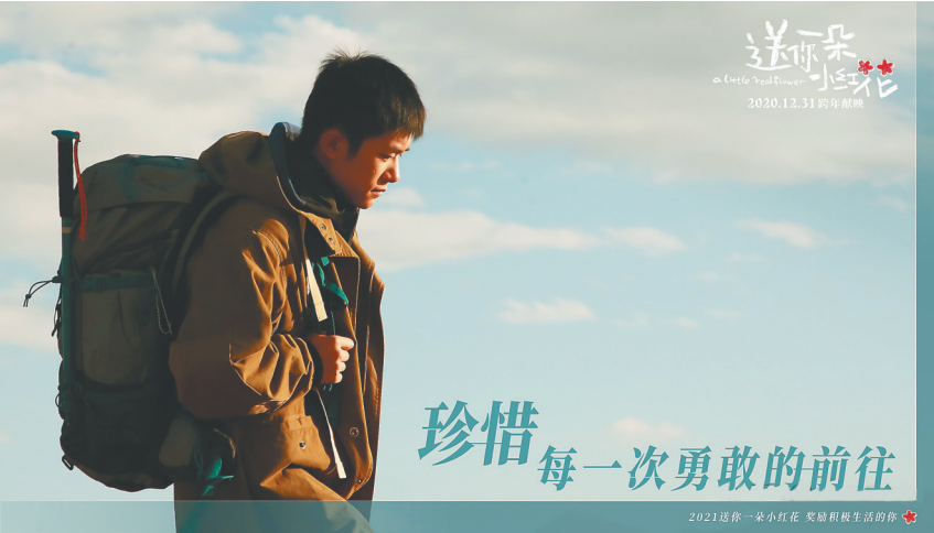
《送你一朵小红花》海报

元、3亿元和2亿元票房，在总票房中的占比共计达到超八成，而在观众人次方面，三部影片在元旦小长假期间为电影院分别输送了1288万人、795万人和490万人的观众人次，累计超过2500万人次。