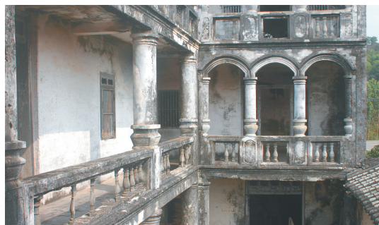
建于1935年的博鳌镇奎岭村何家罗马式豪宅。