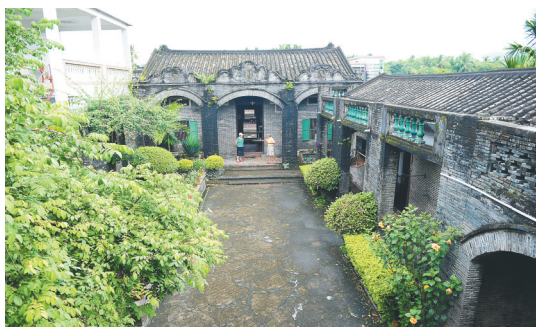
海南省级文物保护单位中原镇仙寨村王家大院。