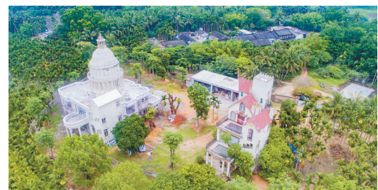
中原镇许姓两兄弟洋气十足的网红新居。