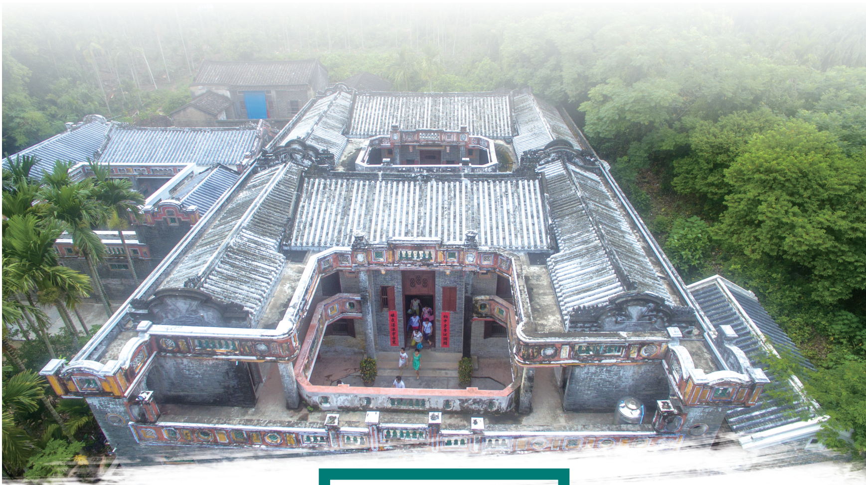
始建于1682年、酷似城堡的博鳌镇留客村蔡家大院，是国家级文物保护单位。