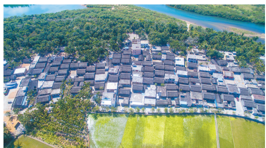
万泉河畔的石壁镇洲城村的连片民居。