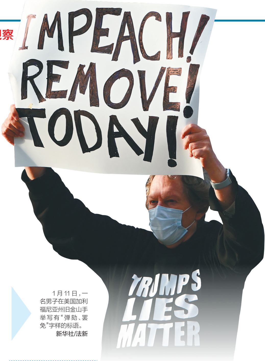
1月11日，一名男子在美国加利福尼亚州旧金山手举写有“弹劾、罢免”字样的标语。

弹劾条款草案称，特朗普“煽动叛乱”“干涉权力的和平过渡”“严重危及”美国和美国政府机构的安全，给美国人民造成“明显伤害”，如任其继续执政，将“对国家安全、民主和宪法构成威胁”。