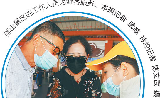
南山景区的工作人员为游客服务。

不只是海鲜价格,三亚市政府还致力打造三亚放心游消费市场监管平台,实现旅游消费数据的实时采集和联网监管,为游客提供旅游出行中的消费诚信保障。