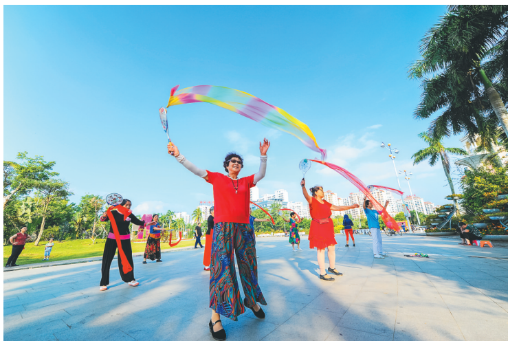
“候鸟”老人在琼海嘉积镇街头跳舞。