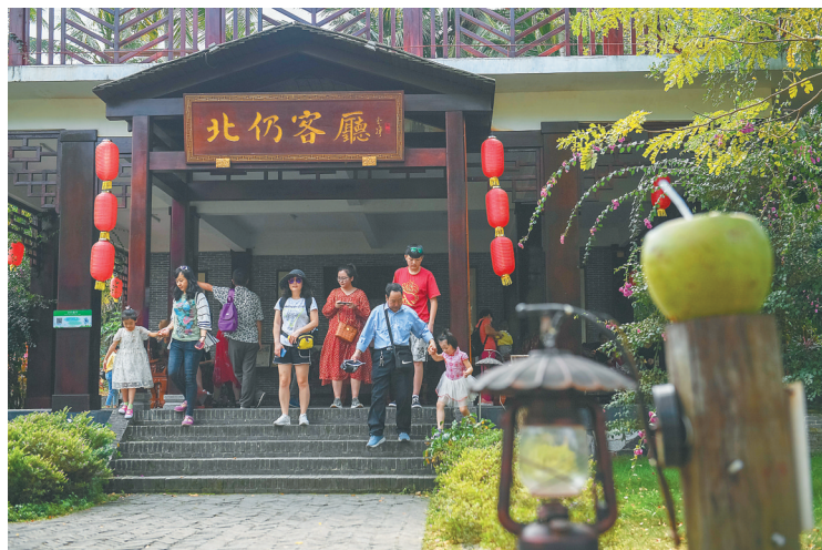
琼海北仍村受游客青睐。

会展业的发展,是琼海经济稳定增长、结构持续优化的一个侧面。五年来,琼海市的健康产业从无到有,旅游产业优化升级,热带高效农业提质增效,休闲渔业在全省率先起步发展,互联网产业和高新技术产业发展势头强劲,无一不反映着琼海市在聚力构建现代产业体系工作上马不停蹄向前迈进。