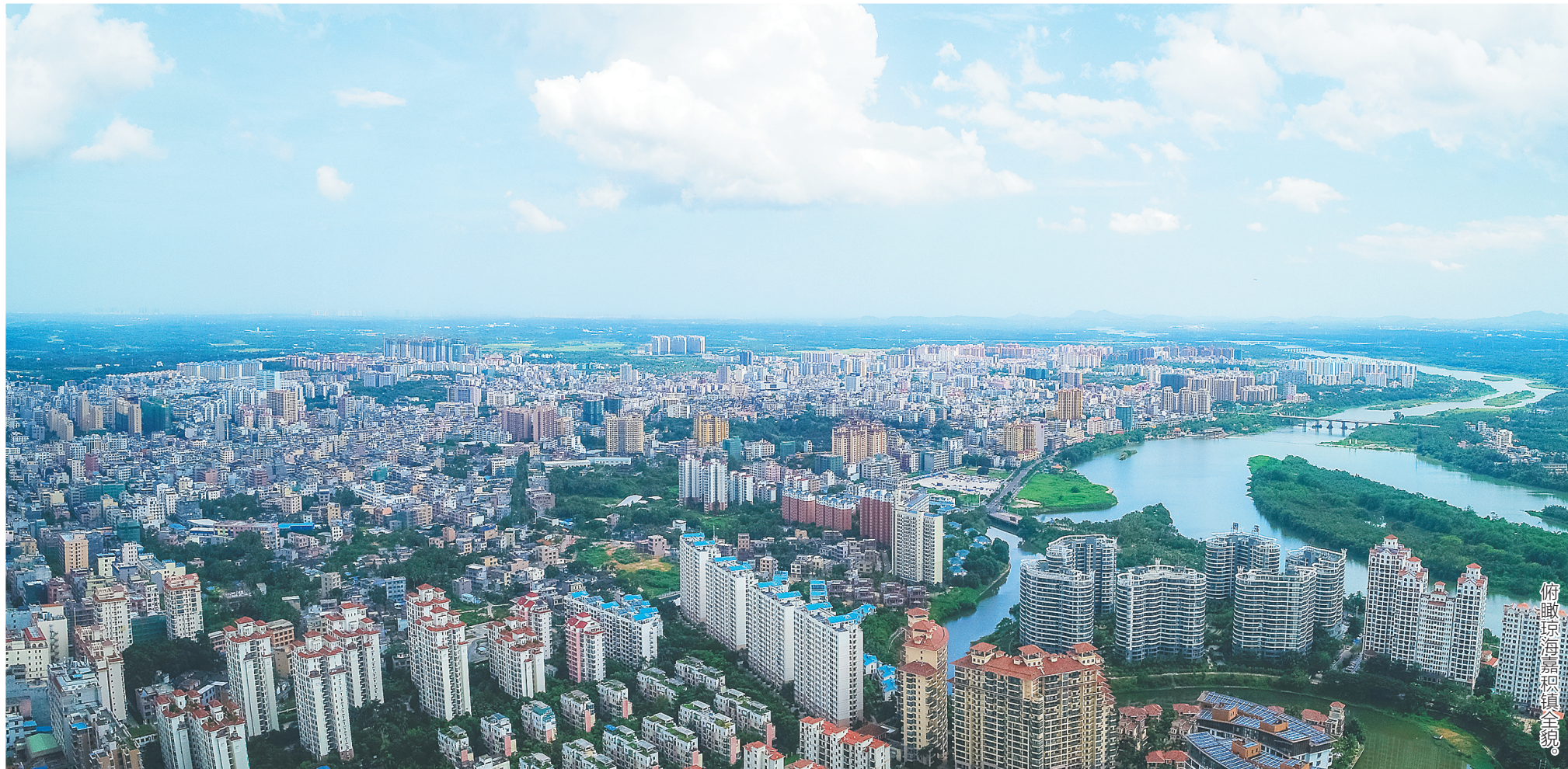
俯瞰琼海嘉积镇全貌。