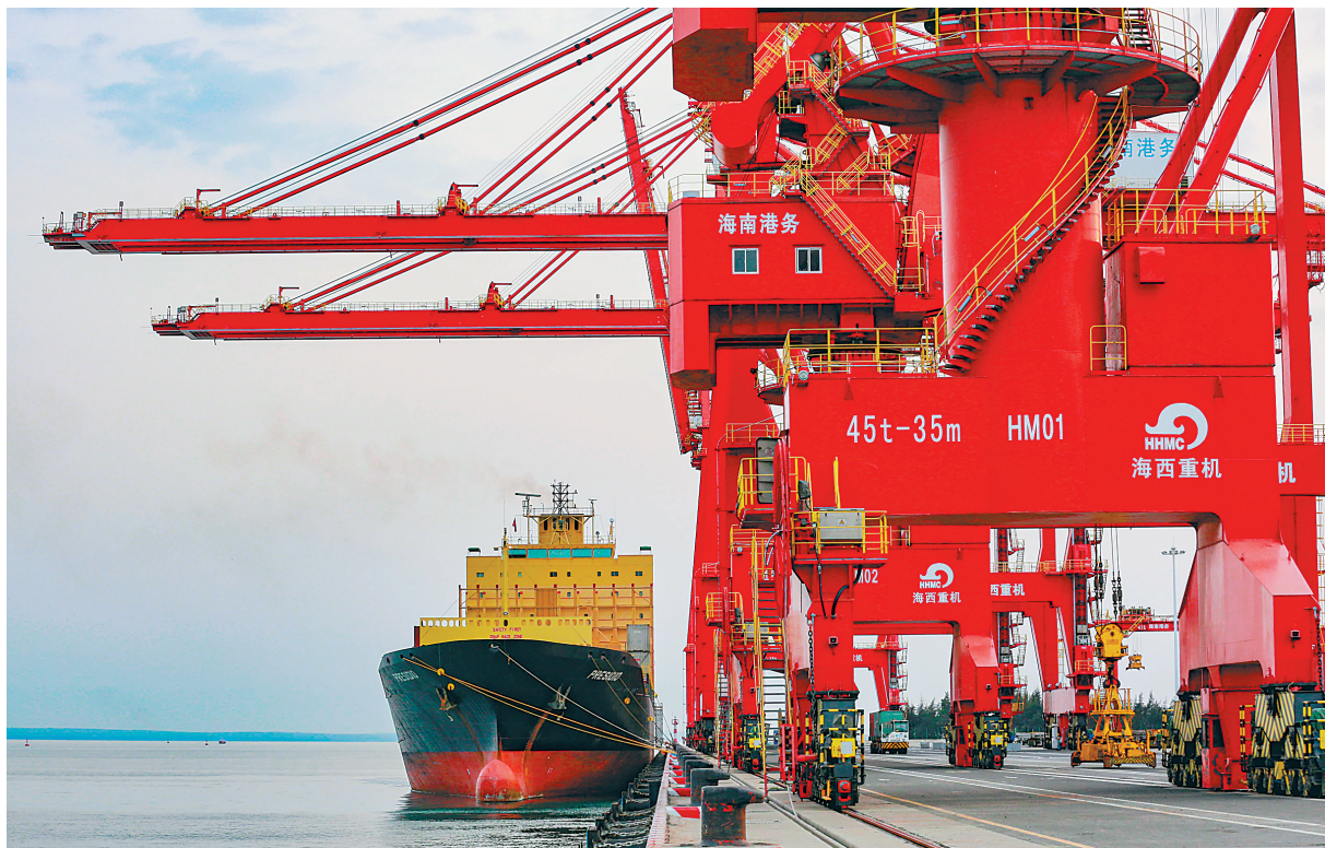
洋浦小铲滩码头停靠着一艘运输货物的船舶。

吕先志表示,“十四五”期间,我省将坚持集约集聚、争先创优、优胜劣汰原则,实施园区动态调整机制和高质量发展行动计划,高标准建设自贸港产业重大功能平台。在重点产业园区先行先试自贸港政策措施,推动贸易、投资、资金、人员、数据自由便利有序流动,争取更多“早期收获”在园区落地。同时,还将集中力量打造若干千亿级、百亿级产业园区,形成产业集聚发展新高地。(本报海口1月17日讯)