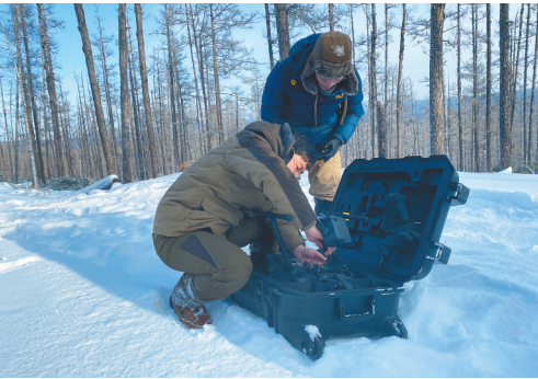
近日，东北林业大学科研团队首次使用无人机远红外热成像系统在内蒙古大兴安岭林区采集到野生动物种群活动画面。

天津港集团总裁焦广军向记者介绍，天津港在率先实现单体集装箱码头全堆场轨道桥自动化升级改造之后，拓展应用北斗卫星定位技术，用时不到1年，实现了对传统集装箱码头的全流程自动化改造。改造后的集装箱码头整体作业效率提升近20%，单箱能耗下降20%，综合运营成本下降10%。