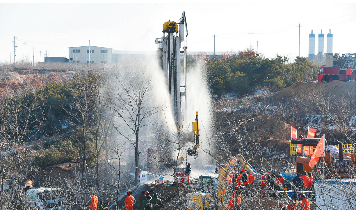
1月17日，救援人员在全力打通钻孔。