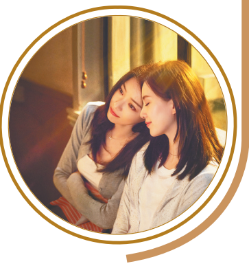
本文配图除署名外均为《流金岁月》(2020)海报或剧照