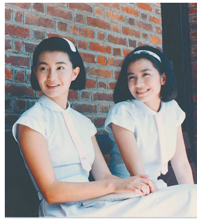
1988年上映的电影《流金岁月》剧照。

近年来，从电视剧《我的前半生》开始，亦舒的故事又频频闯入人们的视线，电影《喜宝》、电视剧《流金岁月》接连上映。如前所述，亦舒的作品是非常适合改编成影视作品的。她太了解女人和都市了。在她的笔下，都市生活被一一具象化，那些在都市的“流金岁月”里挣扎浮沉、希望获得爱和归宿的女人们显得那么动人。