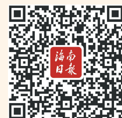
扫二维码,看创意海报《后浪·1926》。

1926年6月,中共琼崖第一次代表大会召开,参会的12名代表平均年龄仅26岁,这群年轻人是彼时当之无愧的“后浪”,他们用奋斗的青春和年轻的热血,书写了琼崖革命的不朽传奇。 海南日报创意工坊策划制作的海报《后浪·1926》,通过“照片+简介”的方式,重新凝视烽火岁月里那一张张年轻的面孔。