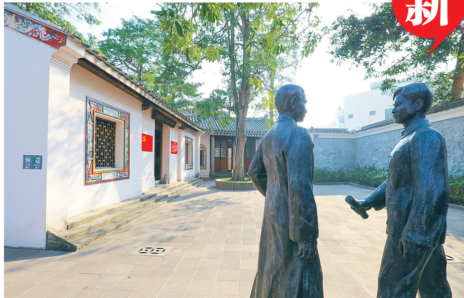
如今的中共琼崖第一次代表大会旧址。