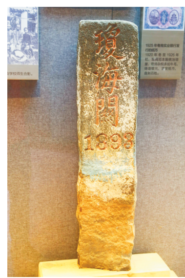
中共琼崖第一次代表大会旧址内展出的“琼海关”碑。

会派员全面接管琼海关。同年6月,中华人民共和国海口海关成立。新中国成立后的几十年里,海口海关日益壮大。2020年,借助海南自贸港建设的东风,海南省跨境电商业务高速发展,海口海关所属马村港海关共监管放行跨境电商网购保税进口申报清单125.5万单,总货值达5.26亿元,同比分别增长635.3%、672.9%。 (本报海口1月18日讯)