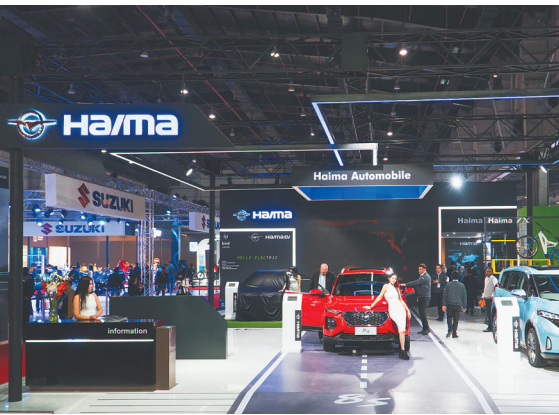
2020年，海马汽车首秀印度新德里国际车展。