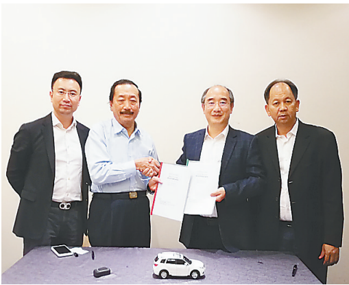
2019年，海马汽车考察马来西亚市场。