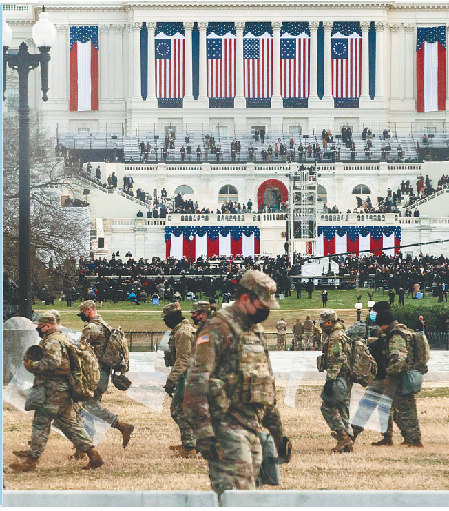
美国国民警卫队队员在执行总统就职典礼安保任务。