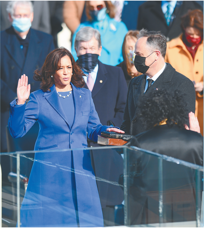
哈里斯(左前)在就职典礼上宣誓就任美国副总统，她成为美国历史上首位女性副总统。