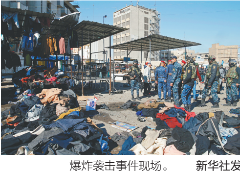
爆炸袭击事件现场。

据新华社巴格达1月21日电(记者张森)伊拉克卫生部21日说，当日发生在首都巴格达的两起自杀式爆炸袭击事件死亡人数已升至32人，另有110人受伤。 伊拉克卫生部长哈桑·塔米米发表声明说，巴格达卫生机构已接收32具遇难者遗体，为总共110名伤者提供治疗，其中绝大多数轻伤者在接受治疗后离开了医院，但仍有36人需接受进一步治疗。 伊内政部一名不愿透露姓名的官员表示，两名自杀式爆炸袭击者当日上午在巴格达市区一处人员密集的市场内先后引爆爆炸装置，两次爆炸仅间隔数分钟。 目前尚无任何组织或个人宣称制造了袭击。