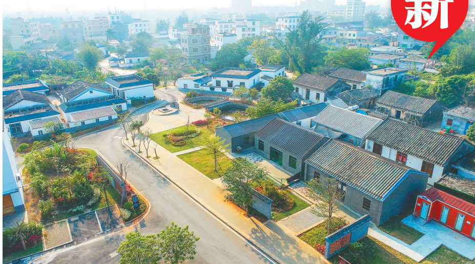
如今,海口市美兰区灵山镇仲恺村正在建设红色美丽乡村项目,带动村民致富。图为仲恺村新貌。