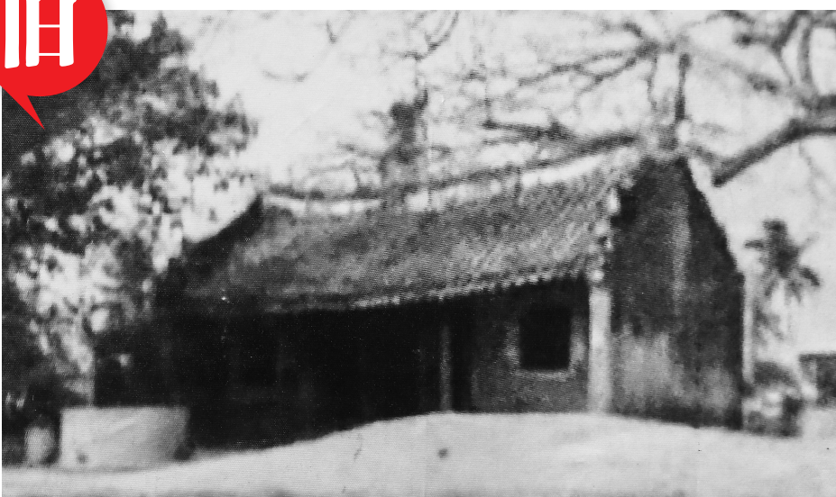
海口市美兰区灵山镇仲恺村关圣庙旧貌。