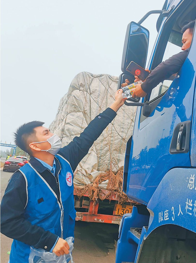
1月25日,海口市多个志愿服务组织派出志愿者到秀英港、新海港提供志愿服务。图为一名志愿者(左)在给货车司机递水。

话语,赢得了滞留司机旅客的点赞。记者了解到,港口企业为滞港司机旅客提供方便共8000余桶,矿泉水近8000瓶、牛奶1500瓶、八宝粥1000份。 据悉,未来几天琼州海峡仍有大雾,客滚航线可能间歇性停航,需过海的旅客司机要根据自身实际情况预约过海。 截至25日22时,秀英港、新海港、南港三港合计滞留车辆超过1500辆。“现在船舶通行顺畅,车辆滞留情况也在慢慢缓解,我们会在保证安全的前提下‘抢运’,让旅客尽快过海!”云文说。(本报海口1月25日讯)