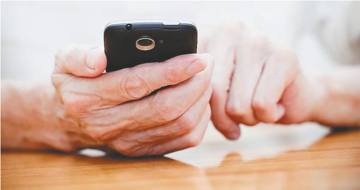
近年来，触网的老年人越来越多。

随着触网的老年人越来越多，以及短视频的迅速传播，许多老年人长时间沉迷于短视频中，对日常生活产生不良影响。信息时代，如何帮助老年人正确“触网”、理智面对短视频这种传播方式，已成为一个社会话题。