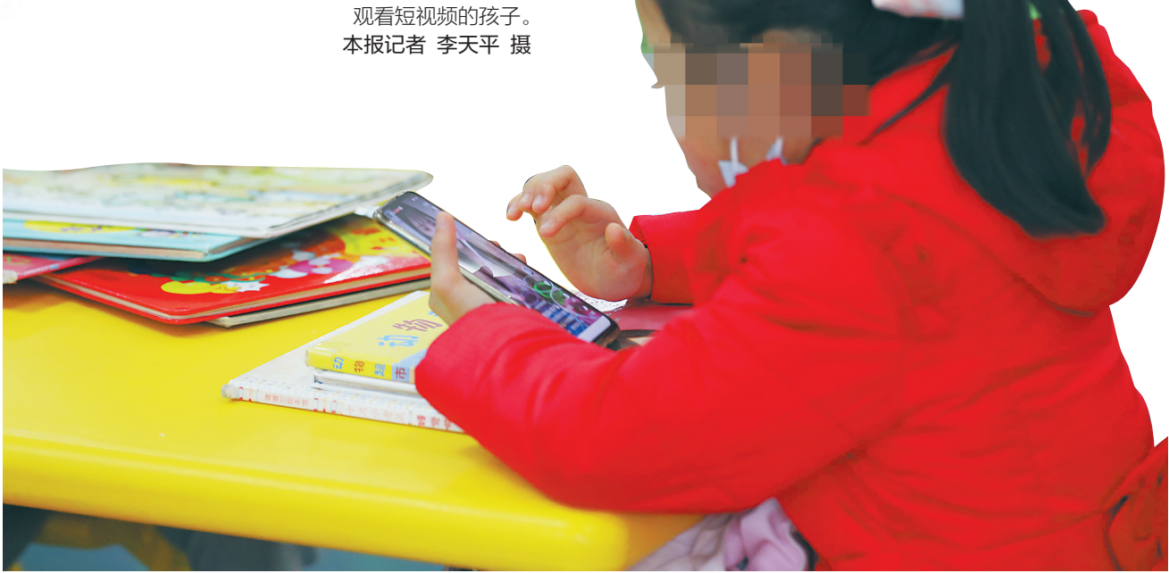
观看短视频的孩子。