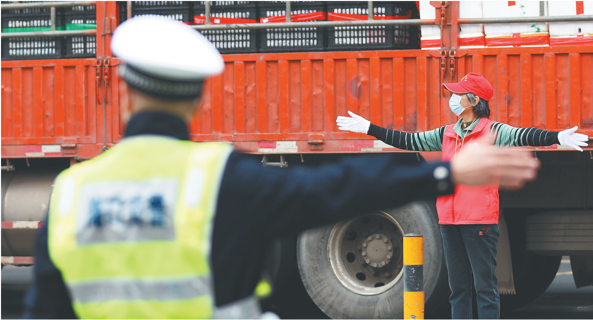
行秩序。一月二十七日,海口秀英港附近,交警和志愿者维持道路通行秩序。