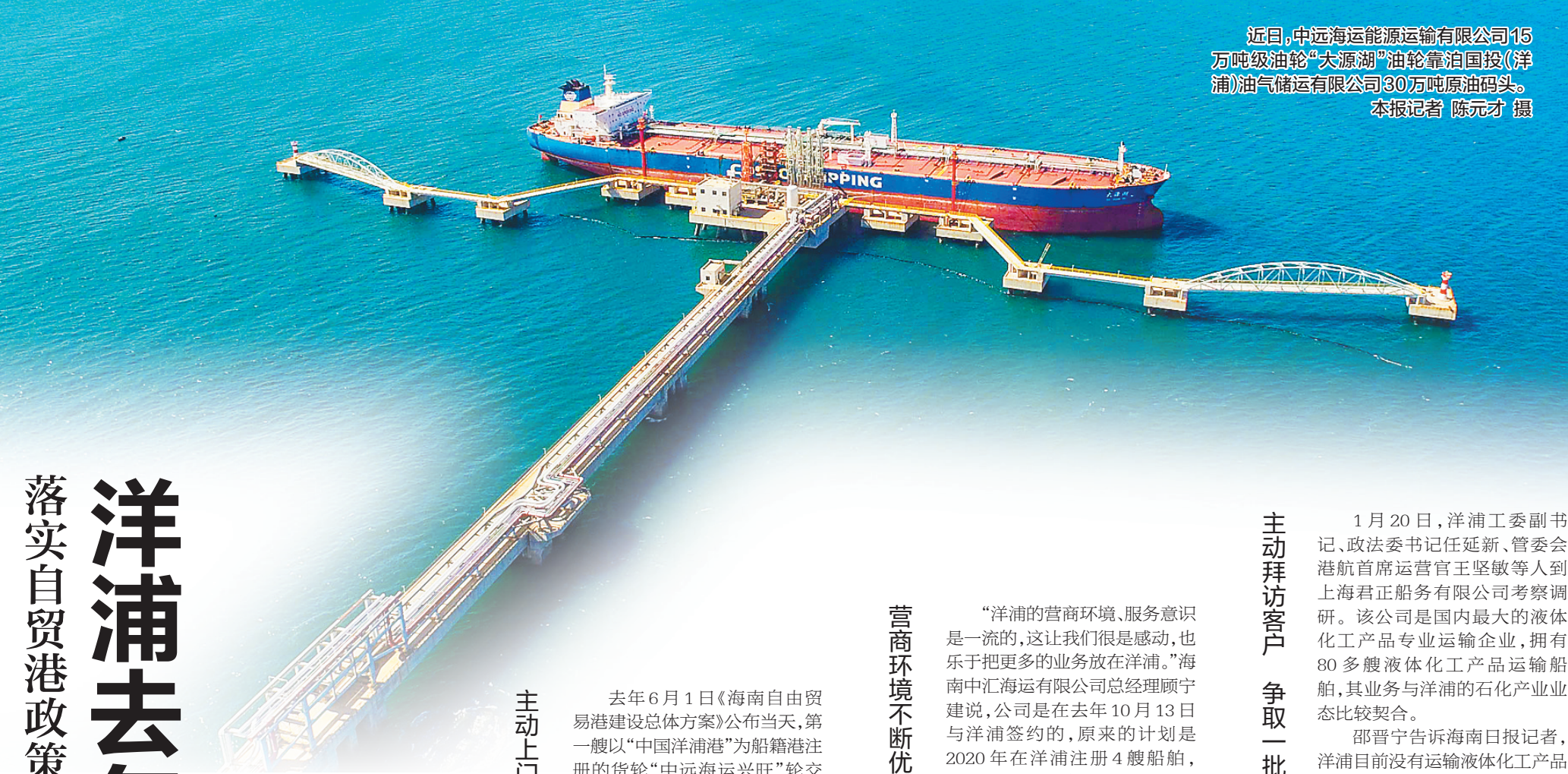
近日,中远海运能源运输有限公司15万吨级油轮“大源湖”油轮靠泊国投(洋浦)油气储运有限公司30万吨原油码头。