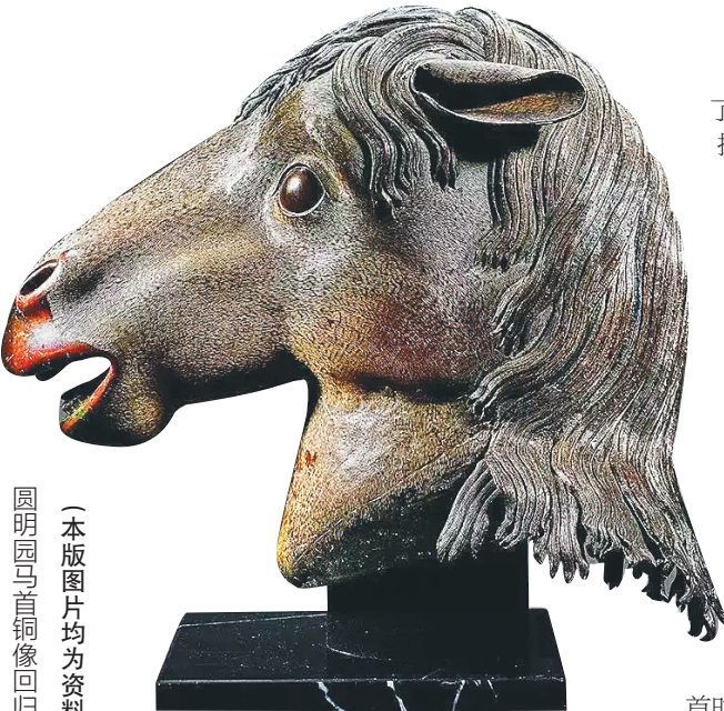
(本版图片均为资料图)

牵动无数中华民族儿女心弦的圆明园铜兽首到底是什么?有人说它们是世间少有的艺术品,有人说它们只不过是水龙头喷嘴而已,有人说它们是报时的时钟,这些说法都对,毕竟也没有谁规定过艺术品就不能有实用价值,或者有实用价值的就不能称作是艺术。圆明园铜兽首本身就是实用的艺术品。