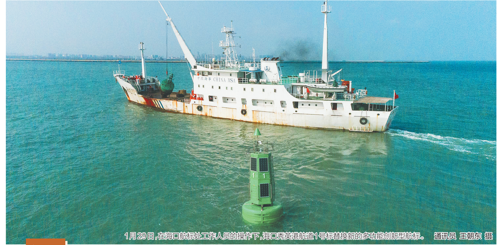
1月29日，在海口航标处工作人员的操作下，海口秀英港航道1号标替换新的多功能创新型航标。

一个相对偏远的革命老区村庄，何以发展越来越有活力，成为远近闻名的富裕村？答案，在漫山遍野的经济作物中；幸福的密码，也在“金点子”频现的东方市三家镇乐安村村民脑海中。 “我们这里种植的黄皮燕窝果，地头价是70元/斤，包装好的一级果可以卖到100元/斤以上。”该基地的管理人员陈金告告诉记者，因为较早从国外引进种植了黄皮燕窝果，乐安村