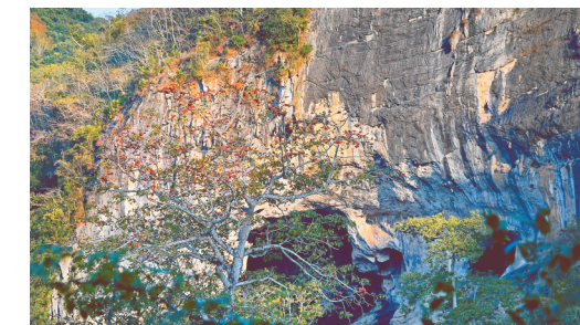
昌江王下乡皇帝洞前的木棉花悄然绽放。