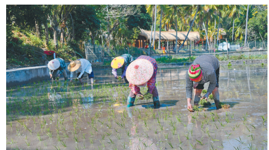
在村边插秧的洪水村村民。