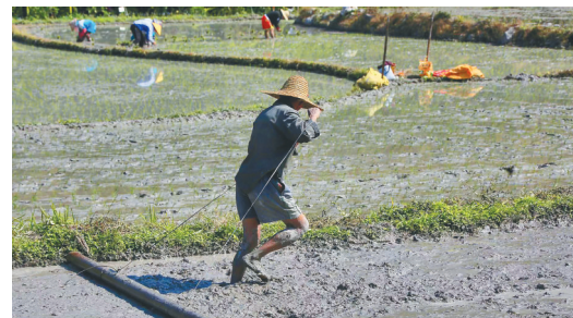
人力耙田。