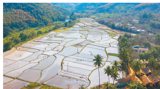
昌江王下乡洪水村旁的百亩良田。