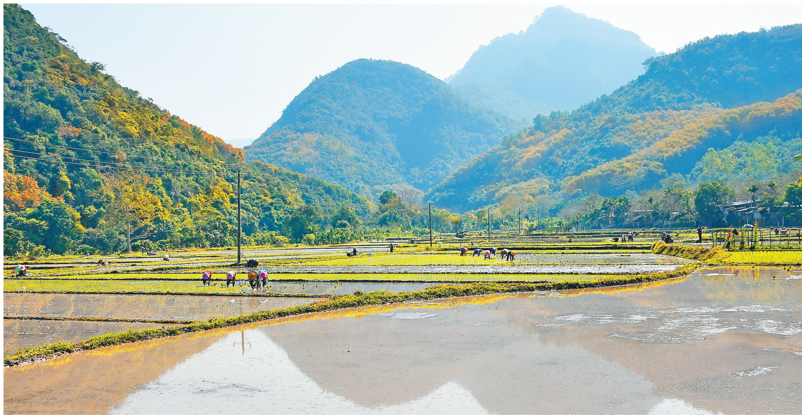
山脉倒映在水田中，与劳作村民的身影，构成一幅天然的山水画卷。