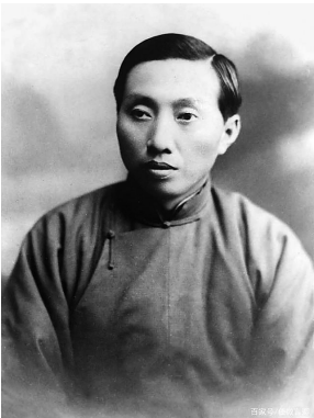
陈望道先生。

今年1月，是我国著名教育家、语言学家和修辞学家陈望道的130周年诞辰。先生是《共产党宣言》的第一位中文翻译者，主编了旷世巨著《辞海》，还曾长期担任复旦大学校长，是中国现当代学术史和教育史上一位绕不过去的人物。 陈望道出生于江南水乡，抗战时期流寓西南，晚年长期居于沪上，足迹遍布天下。老先生在浙江义乌、山城重庆和上海的旧居仍在，有的被辟为纪念馆，有的被居民使用，这些色彩斑驳的老房子见证了那段余温尚存的历史，也见证了陈望道不平凡的一生。