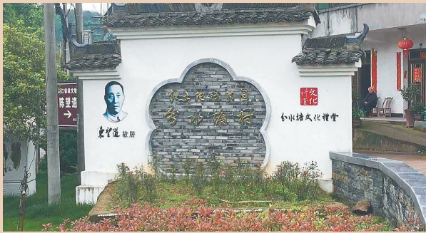
陈望道出生地浙江义乌分水塘村。

1891年1月18日，陈望道出生在浙江义乌一个名叫分水塘的小山村。陈望道少时曾在义乌绣湖书院和金华中学读书，后来到日本东洋大学、早稻田大学和中央大学留学，这种经历在民国时期的乡村很少见到，由此可以看出陈家家境不错，起码是个小康之家。 陈家老宅如今保存完好，这所江南风格的宅院建于晚清宣统元年，是一座二层砖木结构小楼。房屋坐北朝南，呈“凹”字形布局，正室5间，前设开堂，左右厢房各两间，正堂明间门口上方高悬汪道涵题写的“陈望道故居”匾额；二楼为穿斗式，前檐设槛窗。屋子前面是花园，鹅卵石铺路，四面围墙相绕，南面辟单间屋宇式院门。上世纪末，当地政府对这所老房子进行了修葺，室内陈列着陈望道生平事迹、各个时期的照片以及部分珍贵书籍，供人们瞻仰怀念。 陈望道1919年夏回国，随即到杭州浙江省立第一师范学校担任国文教员。在这时期陈望道与陈独秀结识，参与组织马克思主义研究会，并担任《新青年》编辑工作（当时《新青年》编辑部已从北京搬迁到上海）。1919年年末，陈望道得到一本日文版《共产党宣言》，当时正值寒假，他回到分水塘村开始秘密翻译。陈望道手头还有一本英文版《共产党宣言》，他以日文版为蓝本，参考英文版，很快便完成了全书翻译。分水塘至今还流传着一个小故事，陈望道母亲给儿子送粽子充饥，外加一碟红糖水，母亲来取碗筷时发现儿子嘴上漆黑一片，红糖水却原封未动。原来他错把墨汁当了红糖水，母亲又疼又气：“吃完啦，甜不甜呀？”陈望道竟然一点也未察觉，还一个劲地说：“甜，真甜！”弄得母亲哭笑不得。 翻译结束后，陈望道来到上海，在一家印刷所秘密印制了《共产党宣言》。封面是水红色马克思半身像，还印有“社会主义研究小丛书”“陈望道译”等字样，定价为一角大洋。但由于排版疏忽，书的名字错印成《共产党宣言》，这也是《共产党宣言》出版过程中的一个小插曲。 据分水塘村老人回忆，陈家老宅西厢房西原来有一间柴房，陈望道就是在这间屋子里翻译《共产党宣言》的。后来柴房毁于火灾，但这本共产主义经典却在国内广为流传，成为中国革命的火种。