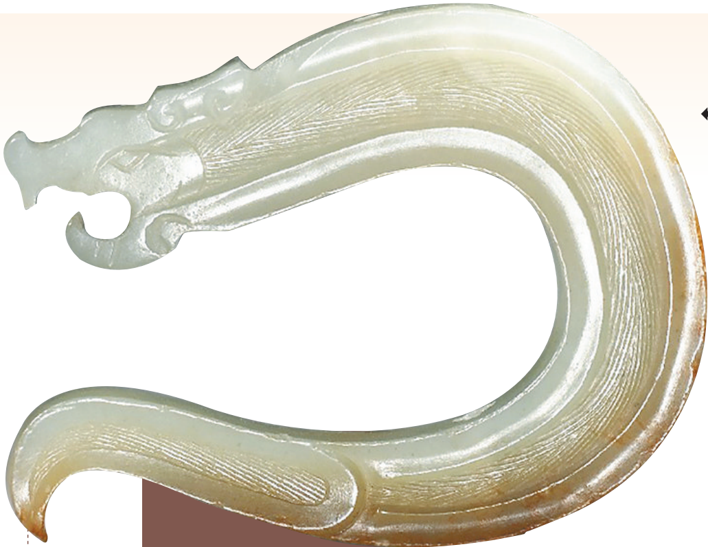
上海博物馆藏战国和田玉龙。

金沙遗址是一处商晚期到西周时期的文化遗存,出土玉器2000余件,这种数量在先秦时期遗址中算是首屈一指。金沙玉器的形制与中原地区的大体相类,但玉石的质地和玉色则独树一帜。虽然也是透闪石类的玉石,但金沙玉器并不是常见的和田玉制作,而是采用四川本地的汶川龙溪玉。龙溪玉自身的特征再加上几千年的埋藏沁蚀,造就了金沙玉器五彩斑斓的颜色。红、黄、灰、绿、白及各种渐变色,再加上玉器颜色的分布纹理,在欣赏玉器的同时,似在欣赏一幅色彩饱满的印象派绘画。