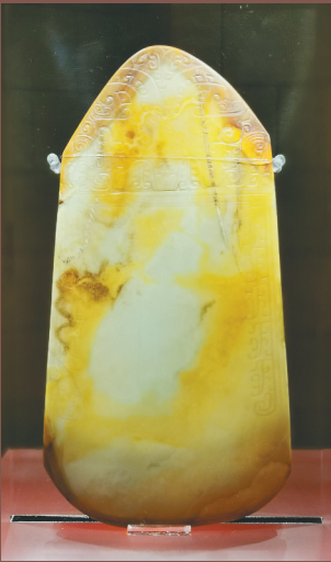
金沙遗址出土兽面纹玉钺。