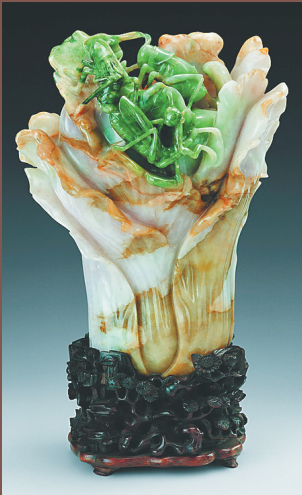
天津博物馆藏清翡翠蝈蝈白菜。

坊间常说的“赌石”指的主要是翡翠,翡翠的毛料由于被较厚的外皮包裹,虽然根据其外部的“蟒纹”等特征能大约推测翡翠的质地,但毕竟翡翠是自然造化难以人力探索,故而有“神仙难断寸玉”的说法。另有俗语道“一刀富一刀穷”,说的是买带皮的翡翠是一种风险很大的投资行为,翡翠毛料切开后,有可能花很少钱买的料突然大涨;当然也可能重金买的翡翠切开后质地极差,顷刻间倾家荡产。