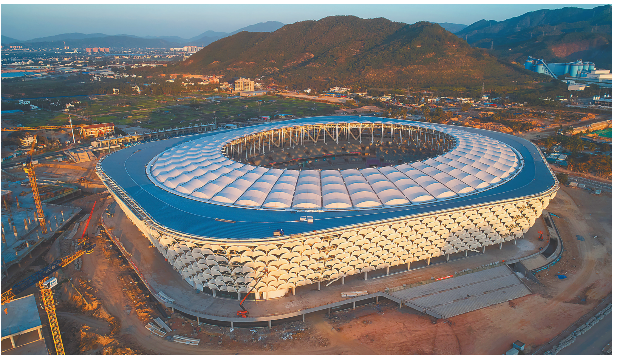
2月2日,清晨第一缕阳光洒在三亚国际体育产业园体育场项目工地上,形似白鹭翅膀的外立面膜优雅灵动。