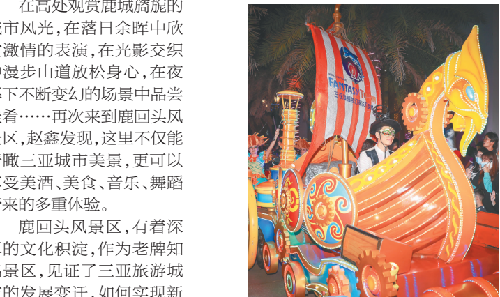
游客在海昌梦幻海洋不夜城观看夜光花车巡游。

“四列小火车涂装红、黄、蓝、绿四种鲜艳色彩，分别命名为‘大力神号’‘甘工鸟号’‘仙仙鹿号’‘旺旺蛙号’，小火车穿梭热带雨林间，沿途能欣赏到石门洞、百米花廊、彩虹当空、七彩风车、鸟语花香5大主题景观。”槟榔谷景区有关负责人介绍。