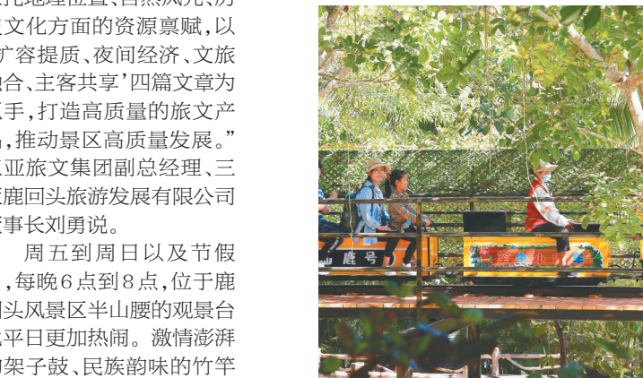
游客在槟榔谷旅游区体验空中小火车项目。