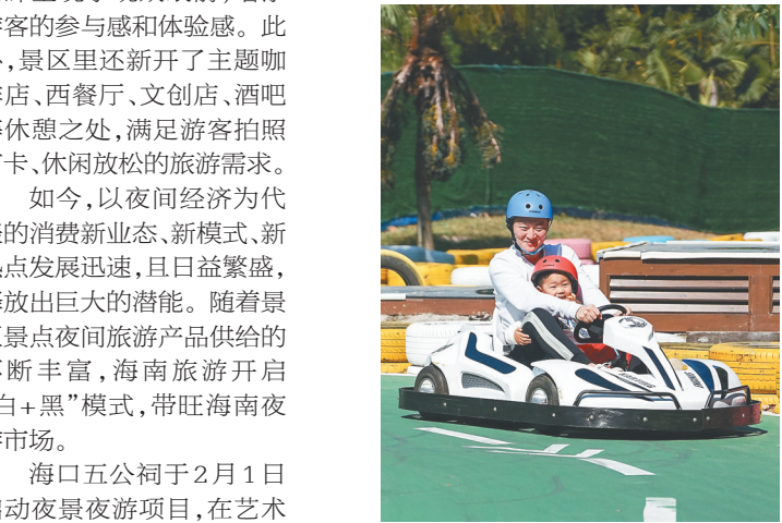
游客在天涯海角游览区体验彩虹卡丁车项目。