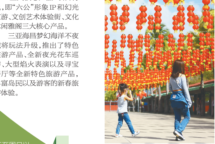
1月31日，三亚南山文化旅游区红灯笼高悬，营造出浓厚的节日氛围。