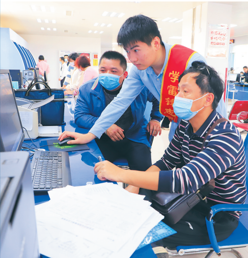
定安县社保服务大厅工作人员指导群众通过网络办理社保业务。