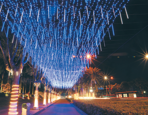
亮化后的定安夜景。

事创业创新的氛围。 可以看出，在抢抓机遇上，定安下定了决心，更坚定了信心。围绕“海澄文定”综合经济圈区域发展目标，定安已经开始以“多规合一”为抓手，“超前布局”县域空间规划。目前，定安正在结合国土空间规划调整，对塔岭工业园区进行适当扩大和调整重点产业方向。可以预见，“十四五”期间，这里将是定安最大的产业承载地，成长成为定安人民的“钱袋子”。 未来五年，定安将继续抢抓做大做强“海澄文定”综合经济圈机遇，进一步解放思想、主动作为，以“争一流、创一流”的精气神，只争朝夕，团结一心，奋起直追，为建设活力定安、静美家园不懈奋斗，为高质量高标准建设海南自由贸易港和做大做强“海澄文定”综合经济圈贡献定安担当。 （本版策划、撰稿/观平 圆图）