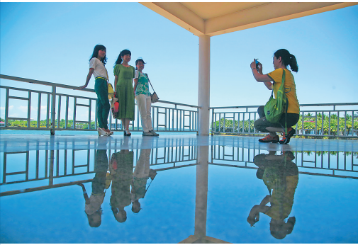
游客在风景优美的南丽湖畔留影。