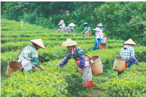
白沙黎族自治县牙叉镇五里路有机茶园，村民在采摘春茶。

在具体规划方面，裴漫玲建议，以鹦哥岭红坎瀑布、“全国乡村旅游重点村”罗帅村为核心，以361国道为轴线，形成以元门乡为白沙的东入口门户集散区，联动牙叉镇（陨石坑、茶园小镇）、南开乡（鹦哥岭）和细水乡（松涛水库），塑造以黎族、苗族文化为内涵的热带雨林国家公园IP，创意核心就是提炼黎族苗族文化元素，根植热带雨林生态，塑造文化形象，全域衍生文化创意产品，进而努力打造乡域国家4A级旅游景区。