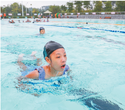
白沙黎族自治县文体中心，一名学生在学习游泳。