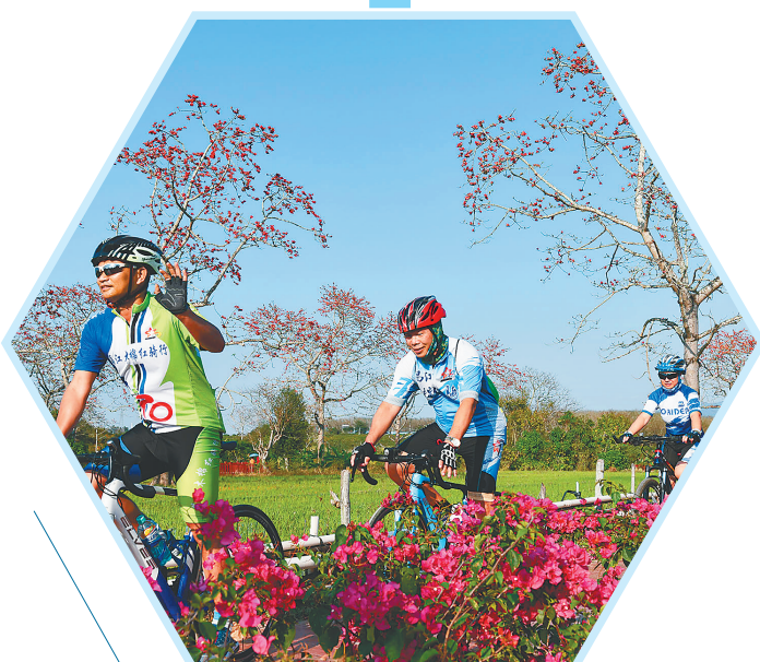
游客在昌江骑行观赏木棉花。

统筹发展和安全,大步提升治理水平。 严格执行行政执法“三项制度”。实施“八五”普法规划,建立健全公共服务法律体系,优化智慧村(居)法律服务。深化平安昌江建设,常态化推进扫黑除恶工作,扎实开展禁毒大会战,推进“四位一体”新机制建设。