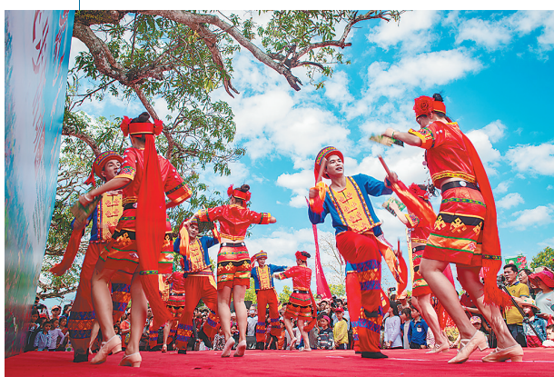
昌江黎族同胞载歌载舞庆祝“三月三”。