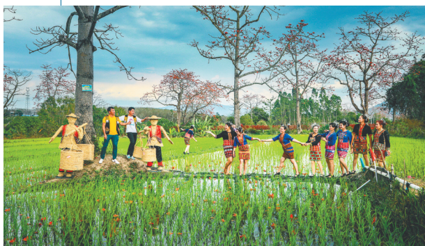
昌江黎族同胞在田间对歌。