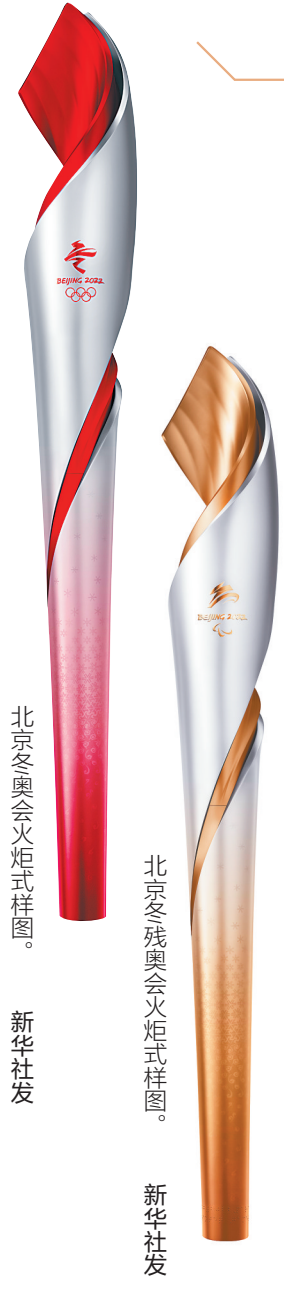
北京冬奥会火炬式样图。