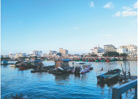
排港村畔的潭门千年渔港。孟晓 供图 策划/撰文 孟晓