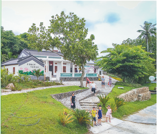
沙美村，民宿朴实又不失时尚。