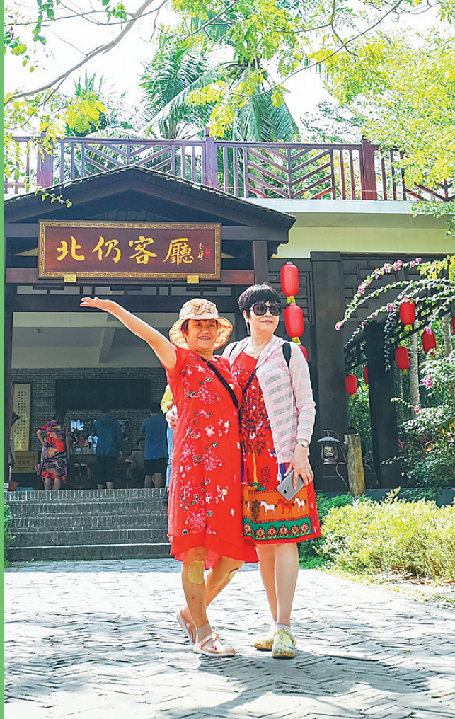
游客在北仍客厅合影。