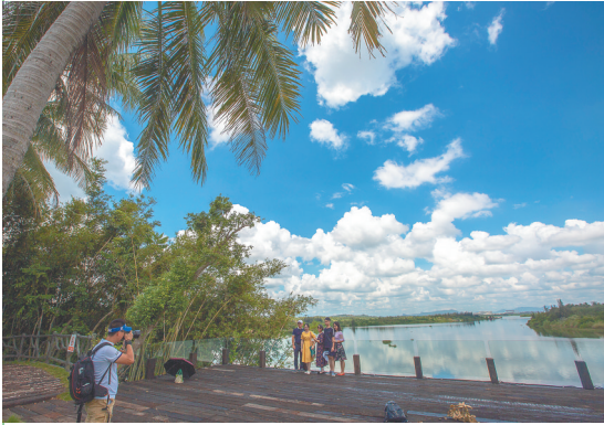
在留客村，正在游玩的游客在最美的地方“打卡”。