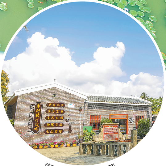
南强村一景。