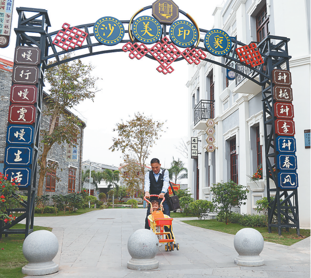
一老一少在沙美村散步。

的自然与人文结合的气质，俨然一座宜居宜游的自然生态公园。 在这里，家家不闭户，素不相识的村民在自家门口对游人说上一句“进来坐坐”，令人暖心。 春节期间，游客在北仍村，除了能够品尝到美味的咖啡、农家饭菜之外，还可以到农产品特色展示馆里去逛一逛。诸如北仍山柚油、水果、椰子薄饼等琼海当地的特色农产品，在那里一一展示，等待游客品尝。