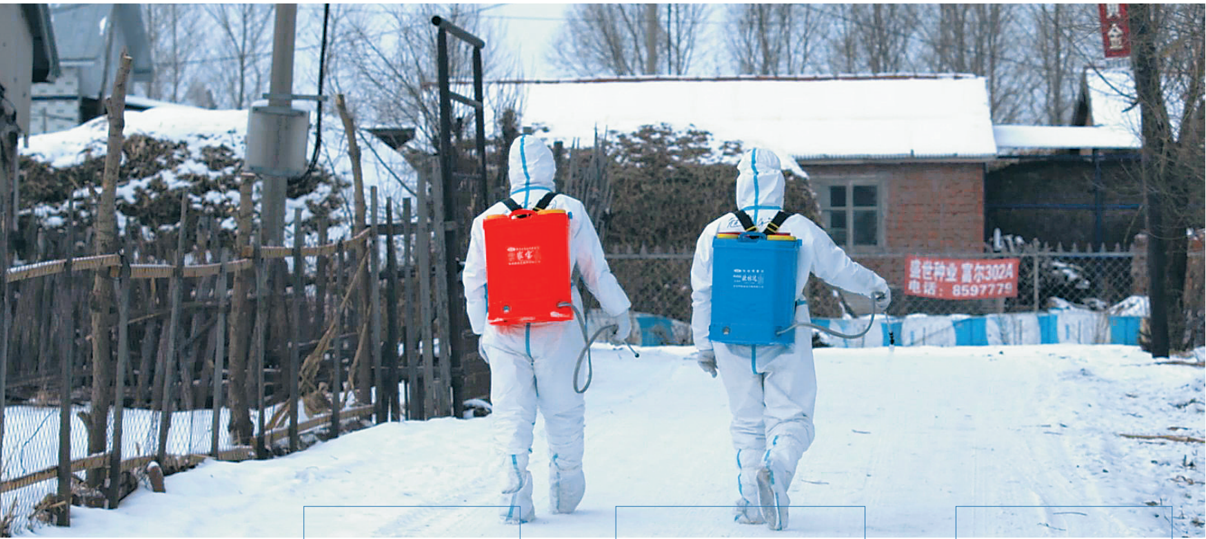
消防队员在黑龙江市望奎县惠七镇惠七村进行公共区域消杀。

截至2月6日15时，全国疫情共有10个高风险地区、48个中风险地区。春节临近，年味渐浓，这些中高风险地区如何做好疫情防控？当地老百姓的年货能不能有保障？春节还能走亲访友吗？