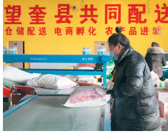
工作人员在望奎县农村电商物流配送中心搬运生活物资。

截至2月6日15时，全国疫情共有10个高风险地区、48个中风险地区。春节临近，年味渐浓，这些中高风险地区如何做好疫情防控？当地老百姓的年货能不能有保障？春节还能走亲访友吗？