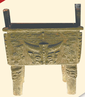
商代牛方鼎。本版图片均为资料图

李冰回了岸,挑选了几百名特别胆大而勇猛的士兵,都配备上硬弓利箭,叫他们守候在江边。这次李冰预先在牛身上系了白布,好让士兵往那没有白布的牛身上射箭。经过一番搏杀,最终李冰化身的大牛将水蛟杀死。后来,人们在江边为李冰修了庙,庙前特地打造了一头石牛,来纪念他的丰功伟绩。