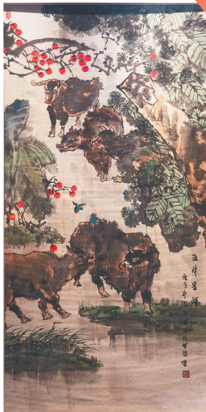
阮江华的中国画《五牛呈祥》。