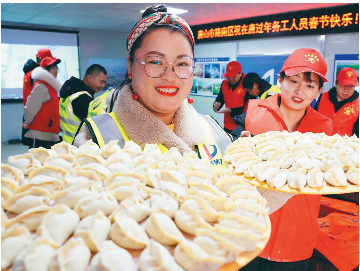
2月11日,河北唐山市路南区的志愿者和中海南新西里住房建设项目部的职工展示她们一起包的饺子。