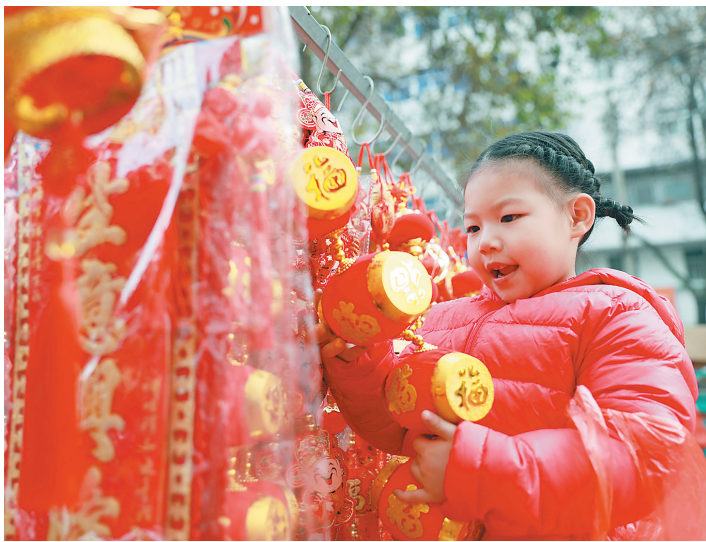
2月11日,一名小朋友在安徽省淮北市一年货市场挑选新年饰品。