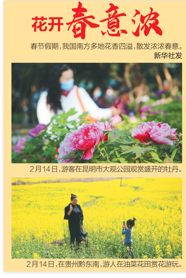
花开春意浓 春节假期，我国南方多地花香四溢，散发浓浓春意。