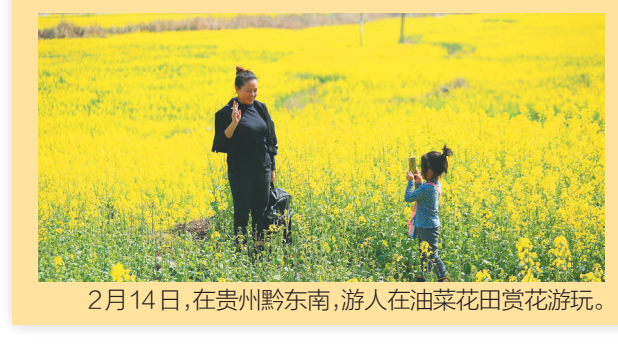
2月14日，在贵州黔东南，游人在油菜花田赏花游玩。