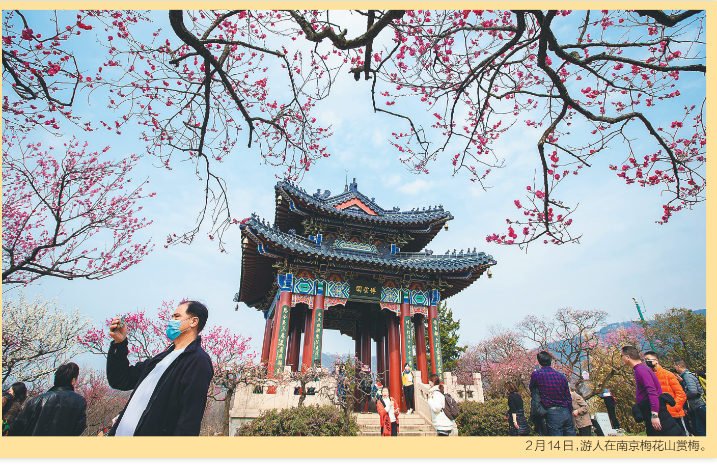
2月14日，游人在南京梅花山赏梅。