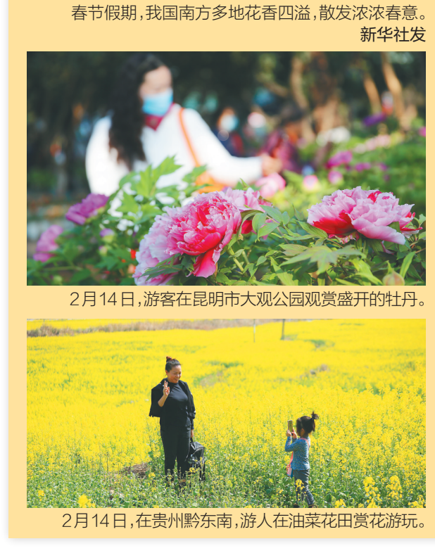
2月14日，游客在昆明市大观公园观赏盛开的牡丹。