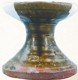
美杨窑酱绿釉高足灯盏。