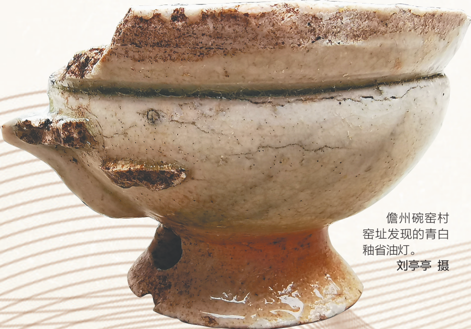
儋州碗窑村窑址发现的青白釉省油灯。