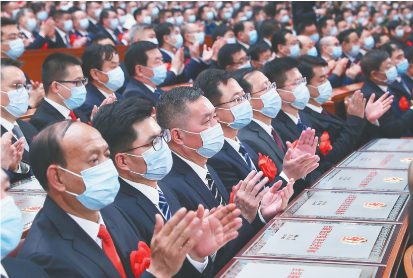
2月25日，全国脱贫攻坚总结表彰大会在北京人民大会堂隆重举行。