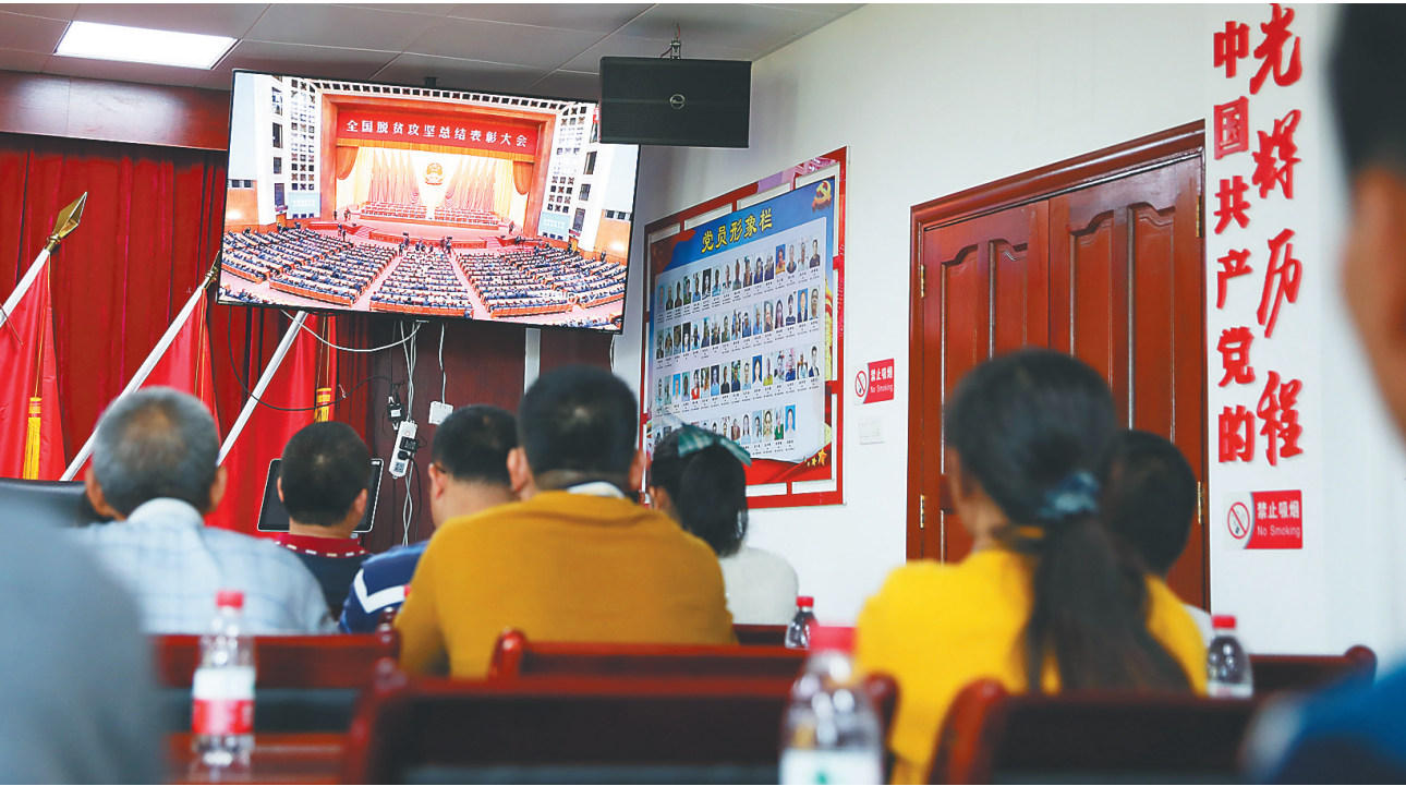
2月25日，在海口市永兴镇建群村，驻村干部、村委会干部和脱贫户一起收看全国脱贫攻坚总结表彰大会。

“习近平总书记强调，我国脱贫攻坚战取得了全面胜利，每一个数据都饱含着每位扶贫干部的一份贡献，我为能参