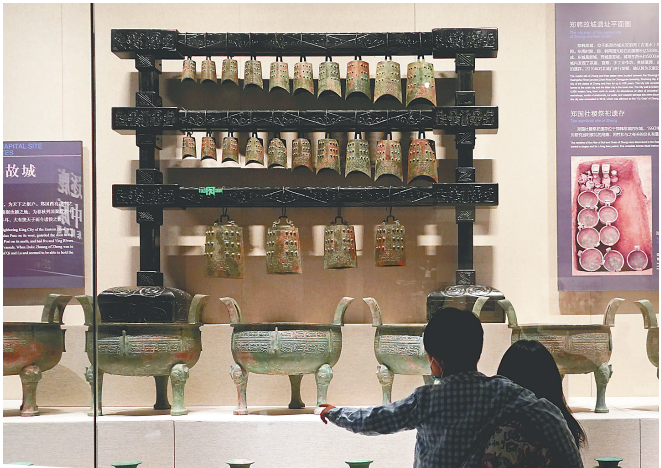
参观者在河南博物院主展馆内观看展品。