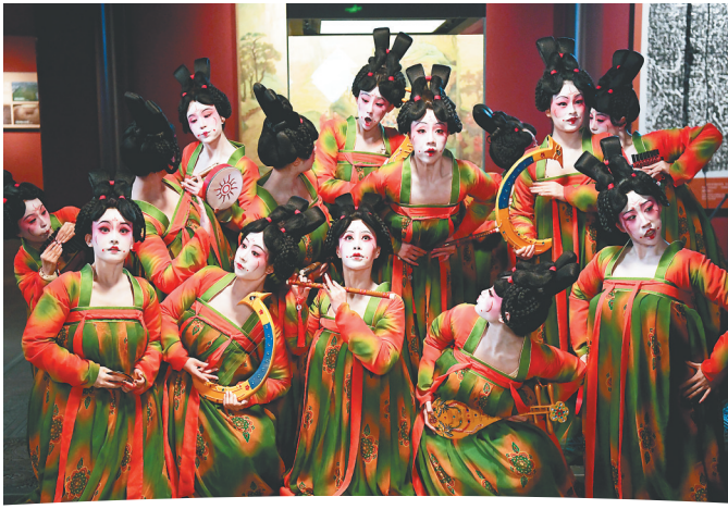
郑州歌舞剧院的演员在河南博物院录制元宵奇妙夜节目。