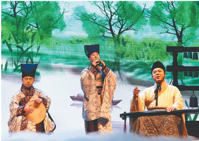
河南博物院华夏古乐团的演员们在为观众演奏。