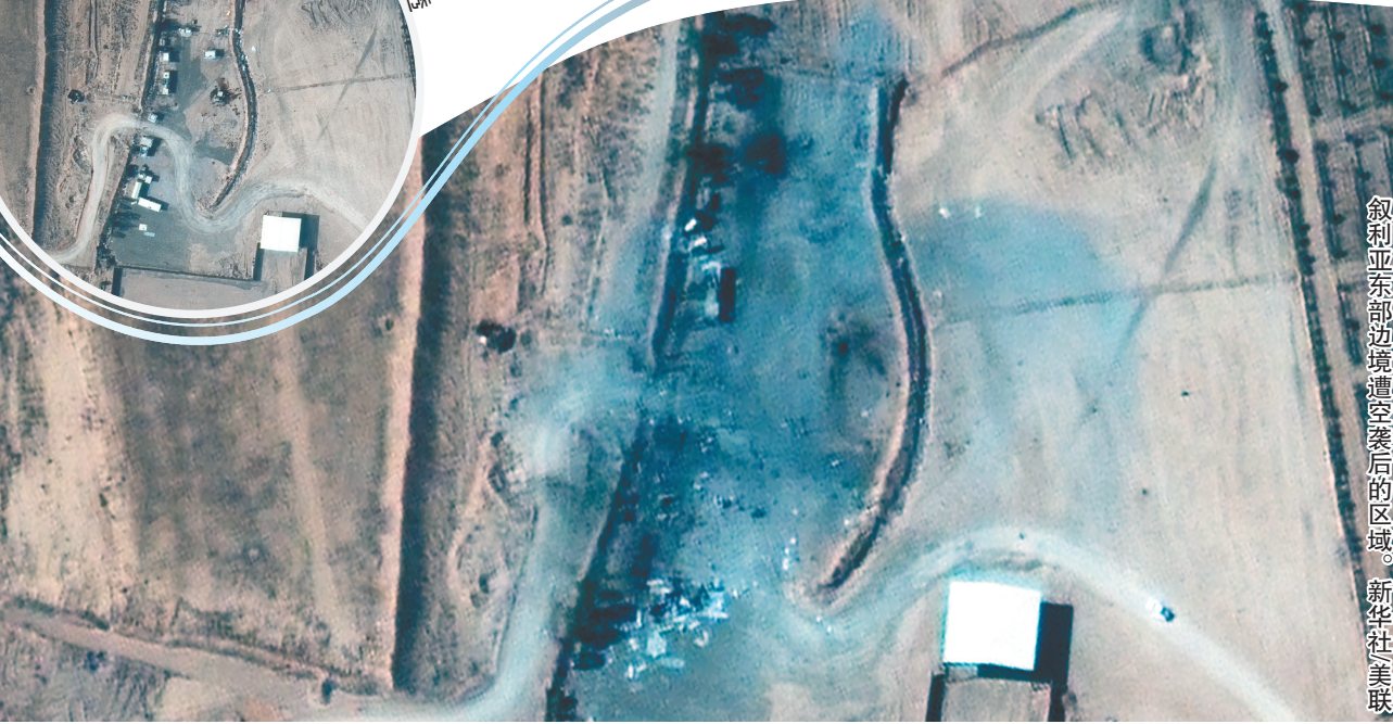
叙利亚东部边境遭空袭后的区域。