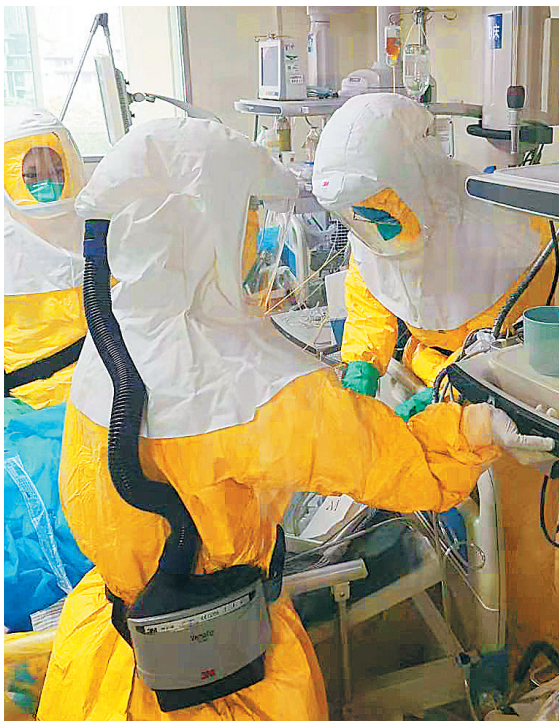
2020年1月31日，省人民医院负压隔离监护病房内，医护人员在为新冠肺炎重症患者治疗护理。

2020年3月11日，随着疫情防控形势积极向好，海口骑楼老街部分餐馆、小吃店恢复营业，烟火味渐浓。