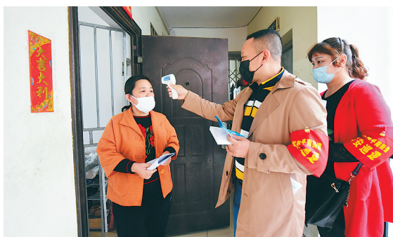
2020年1月26日，海口美兰区和平安街道工作人员深入君尧社区开展疫情排查工作。