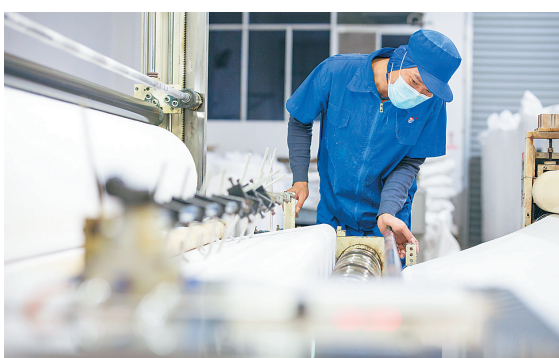
2020年2月1日晚，欣龙控股(集团)股份有限公司工人加班生产熔喷布产品，为口罩等抗疫医用物资生产提供原料保障。