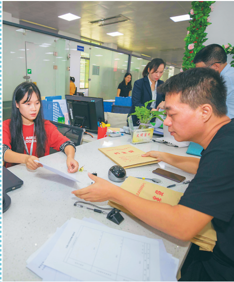
去年10月30日起，五指山市正式启动“一枚印章管审批”服务。图为在五指山市行政审批服务局，工作人员服务群众。