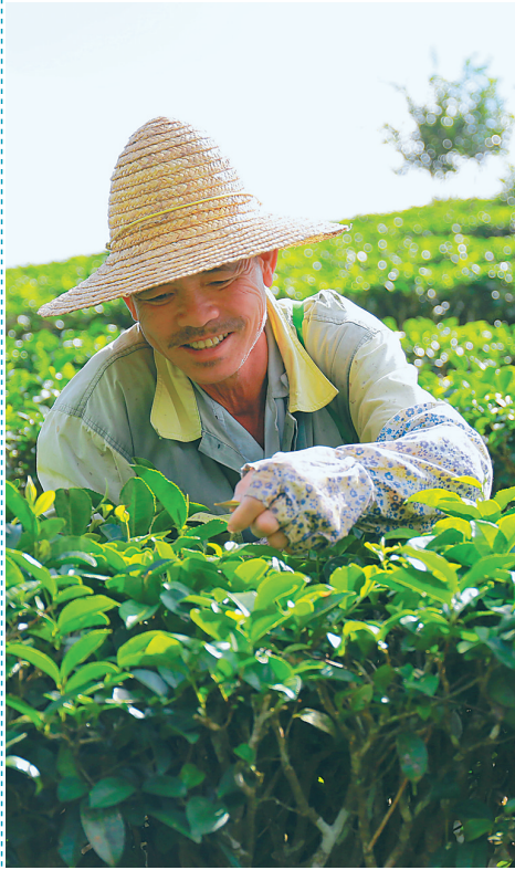
在五指山市水满乡的茶园里，当地农民采摘春茶。