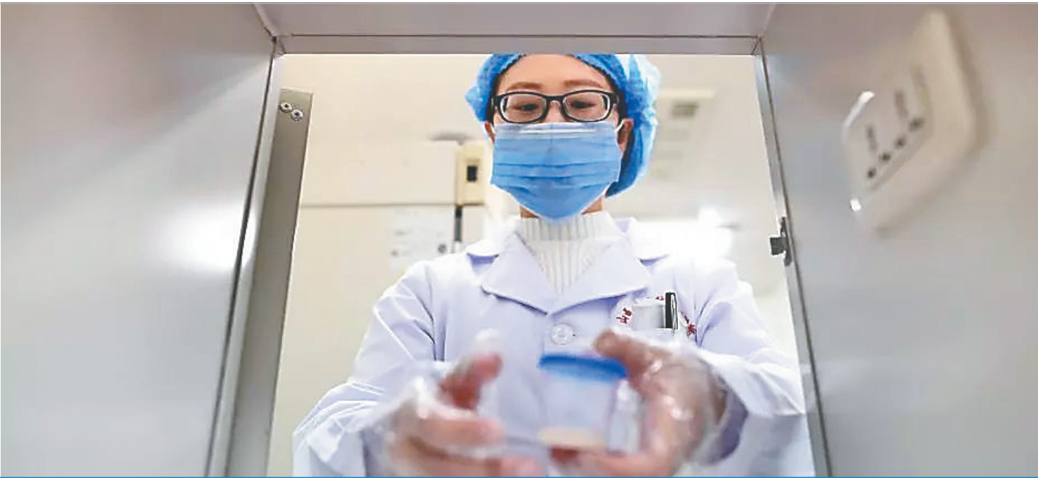
医务人员通过传递窗将精液拿回实验室分析筛查。