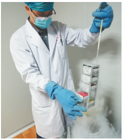
海南省人类精子库医生将精子入库。

随着二孩政策放开，再加上很多人喜欢“牛宝宝”以及接下来的“虎宝宝”，有媒体预言说，牛年来临之际可能导致精子库“缺货”。那么，这种情况真可能发生吗？近日，海南日报记者走访海南省人类精子库了解到，目前精子库储备充足，相关负责人也明确，“二孩放开”实际上对精子库影响甚微。随着各个省市区都至少建起一个人类精子库，供精日益增加，没有出现“精荒”，目前供需基本平衡。该负责人同时也表示，目前人们对精子捐献的常识了解还十分有限，亟待宣传普及。