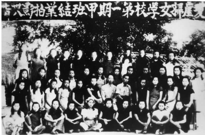
1949年7月，琼崖区党委和琼崖临时民主政府在乐东县番阳墟创办了琼崖妇女学校。图为该校甲班毕业生合影。