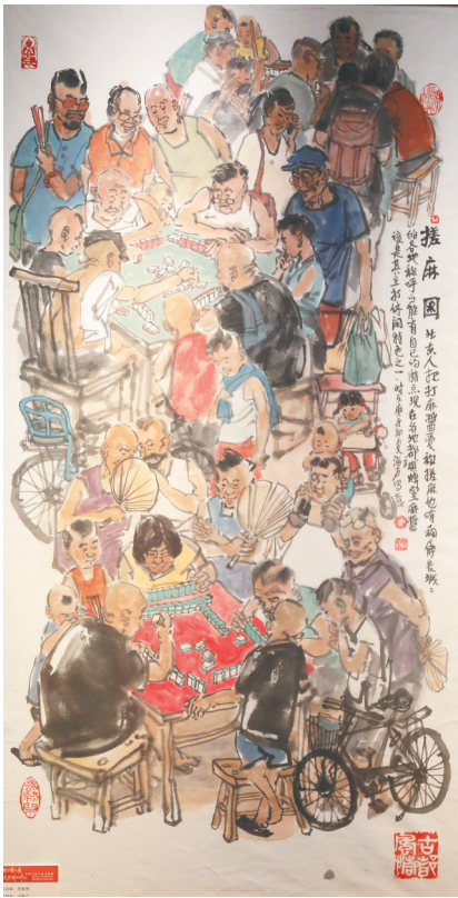
马海方的作品《搓麻图》。