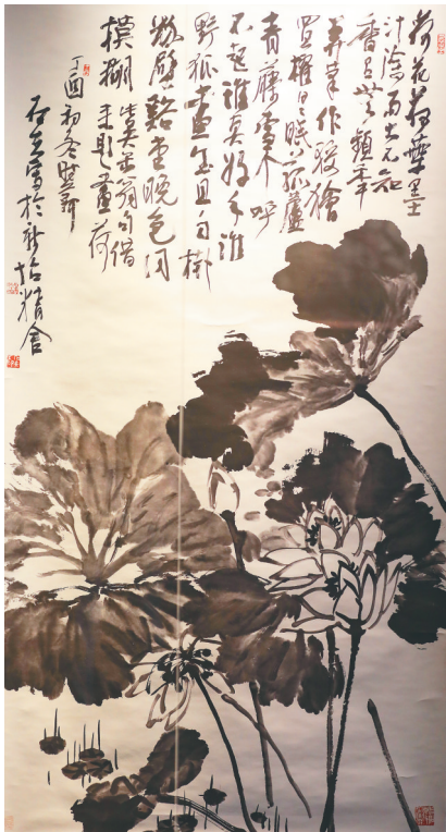
郭石夫的作品《荷花墨图》。