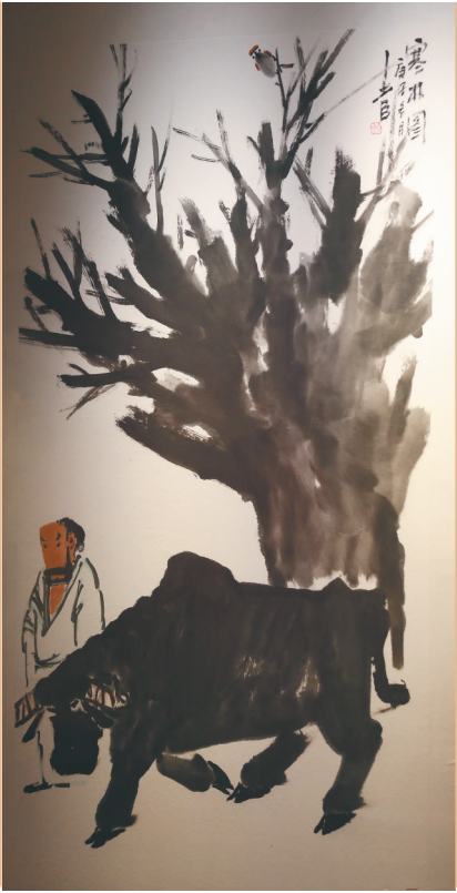
邢少臣的作品《寒林图》。