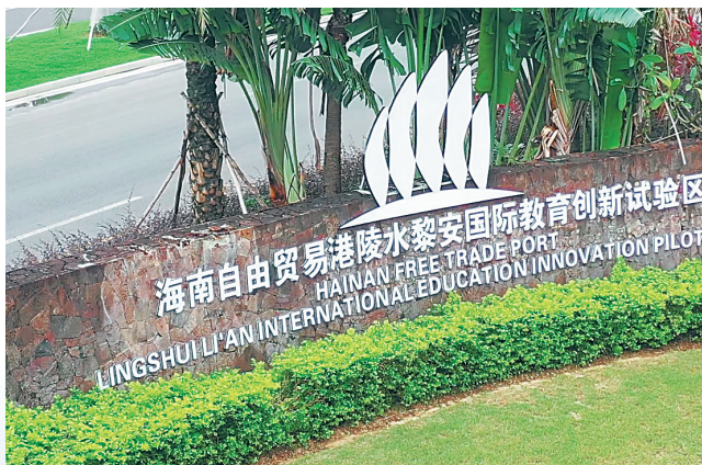
陵水黎安国际教育创新试验区坚持“教、科、产、城”融合发展。

2月23日，俯瞰博鳌乐城国际医疗旅游先行区内的国际创新药械交流转换中心项目。