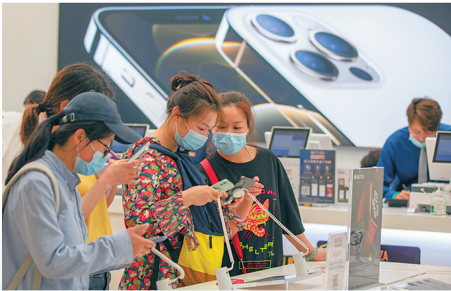
3月8日，消费者在海控全球精品海口免税城选购电子产品。