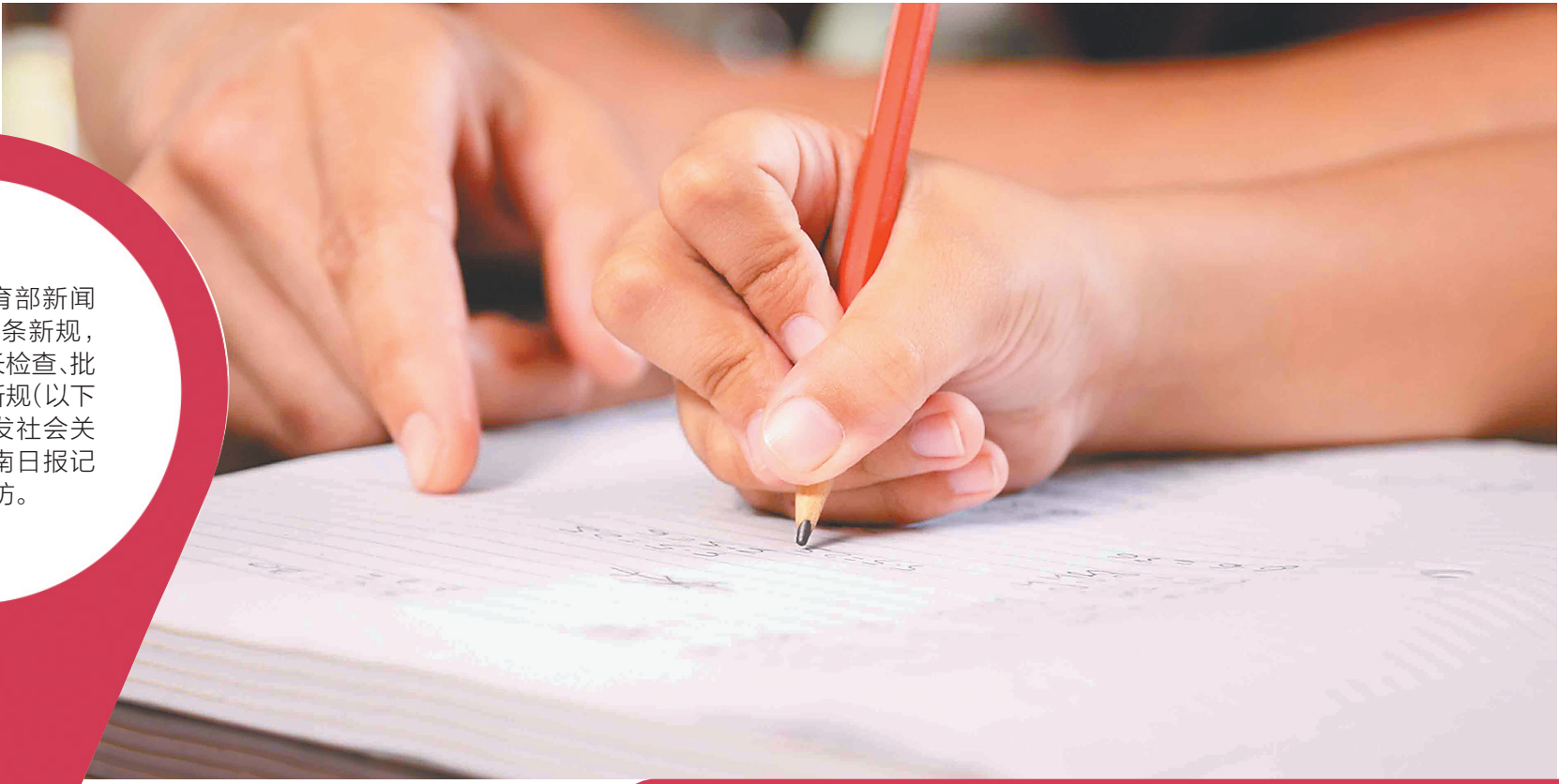
「叫停家长批改作业」不等于家长对孩子学习不闻不问。本文配图为资料图。