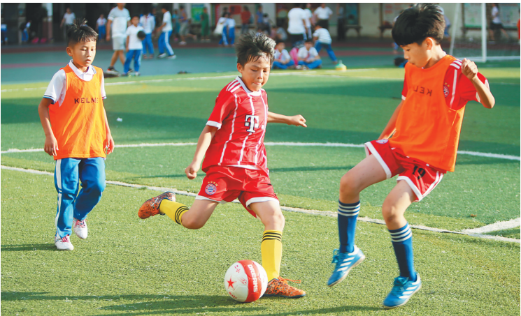
体育课是培养男孩“阳刚之气”的重要课程。