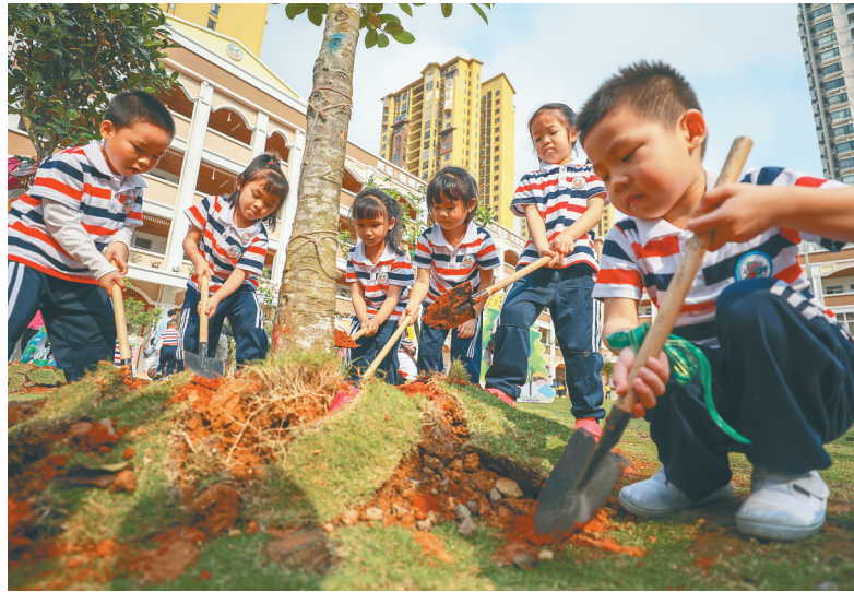
3月12日，在海南省农垦总局机关幼儿园，孩子们参加植树节活动。

同样，海南省农垦总局机关幼儿园也邀请园区孩子和家长对幼儿园内的树木进行认养、栽种。幼儿