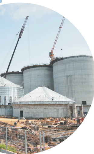
↑ 位于洋浦保税港区的澳斯卡粮油项目加快施工进度,力争今年5月份建成投产。