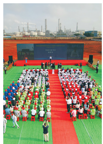
海南自由贸易港建设项目2021年度第二批集中开工活动洋浦分会场开工现场。

今年,洋浦坚持项目为王,筑强产业支撑。在今年2月19日召开的全区招商工作会议上,洋浦工委书记周军平强调,在新的一年里要以起步就是冲刺、开局就是决战的临战状态,一天也不耽误地抓好招商工作,推动洋浦产业结构转型升级、实现高质量发展,为完成“十四五”和今年目标任务打牢基础。