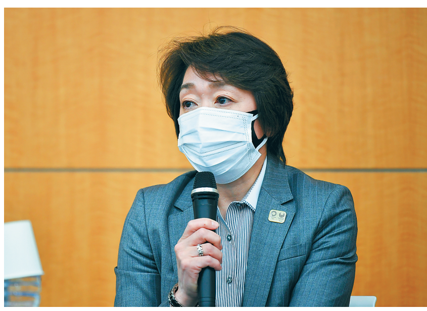
3月18日,东京奥组委主席桥本圣子在紧急发布会上。

东京奥运会开闭幕式总导演佐佐木宏18日宣布辞职,原因是他曾提出有损日本女艺人形象的开幕式表演方案,引发风波。 东京奥组委主席桥本圣子18日召开紧急发布会,就佐佐木宏因发表侮辱女性言论辞职一事发表声明,她在感到震惊的同时,表示将尽快任命新的总导演。 当天正是桥本圣子就任奥组委主席一个月,2月初,她的前任森喜朗也正是因为发表歧视女性的言论辞职。 她说:“我一上任就立刻发起了主张男女平等的动议,希望重建公众对我们的信任。现在我们必须有紧迫感,态度也必须坚决,防止类似事情再度发生。” 据日本杂志《周刊文春》17日报道,佐佐木宏去年3月经由手机聊天软件向策划团队成员提议,让身材肥胖的搞笑女艺人渡边直美穿粉色服装,在开幕式上扮成“Olympig”(奥运猪)从天而降。同事立即以不合适为由拒绝了这个提议。 “我以为这样会让她(渡边)看起来很有魅力,但马上遭到男同事谴责。我感到懊悔。”《文春周刊》援引佐佐木宏的话说,他随后收回这个提议。