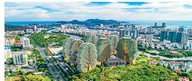
俯瞰恒大美丽之冠。

理想为序,生活为章,开启人生新格局。恒大美丽之冠,匠心打造一站式繁华生活圈,致敬充满诗意的理想生活。(广文)