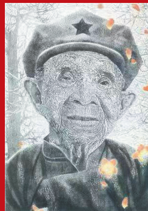
杨全发的版画《英雄花——追念红色娘子军老战士》