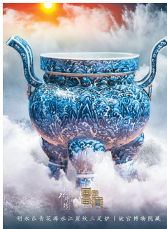
《国家宝藏》第三季海报

近期,《典籍里的中国》《国家宝藏》等一大批弘扬传统文化的电视文化类节目热播,其让人耳目一新的表现形式、深远厚重的文化积淀获得了许多观众尤其是年轻观众的喜爱。它们仿佛构建了一个个时空隧道,带领人们跨越数千年的历史,开启了追根溯源的文化之旅。